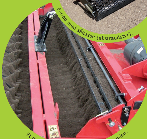
Et pigsold sorterer jord og sten fra hinanden.