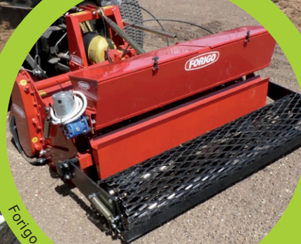
Forigo med såkasse (ekstraudstyr).